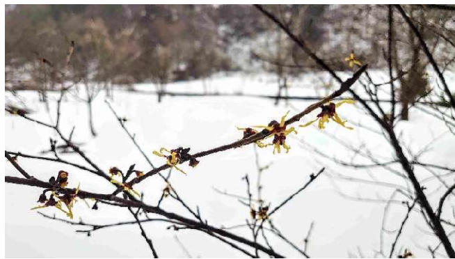
m DSC_4698 カスターニエ R06.03.24AM0715 S.jpg