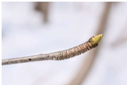
m DSC_6433 コシアブラ頂芽 R06.03.24AM1008 N.jpg