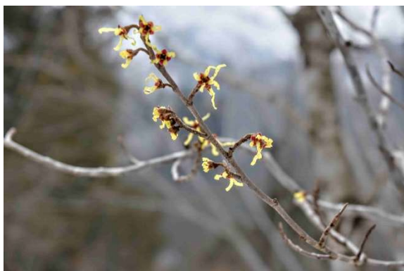
m DSC_6372 展望台マンサク R06.03.24AM0848 N.jpg