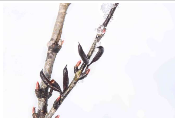
m DSC_6406 カツラ雌樹 実の殻 R06.03.24AM0929 N.jpg