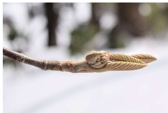
m DSC_6438 オオカメノキ R06.03.24AM1010 N.jpg