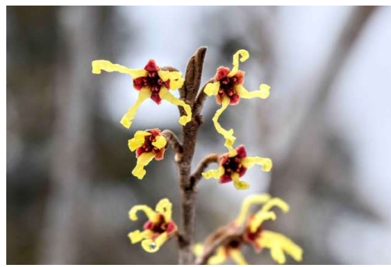
m DSC_6376 展望台マンサク R06.03.24AM0849 N.jpg