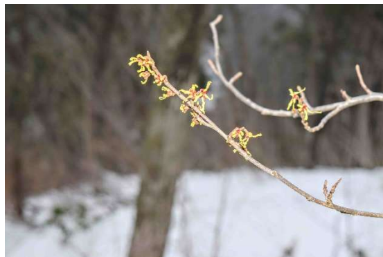
m DSC_6370 展望台マンサク R06.03.24AM0847 N.jpg