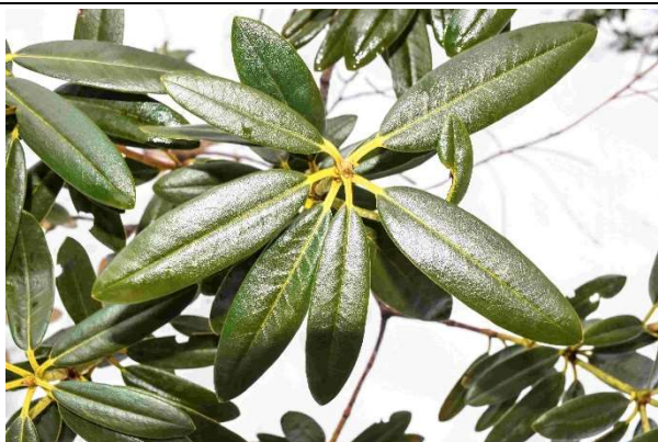
m DSC_6338 シャクナゲノ花蕾 R06.03.24AM0821 N.jpg